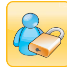
可以远程登录与管理