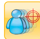
动态侦测摄影系统