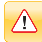
传感器启动警报摄影系统